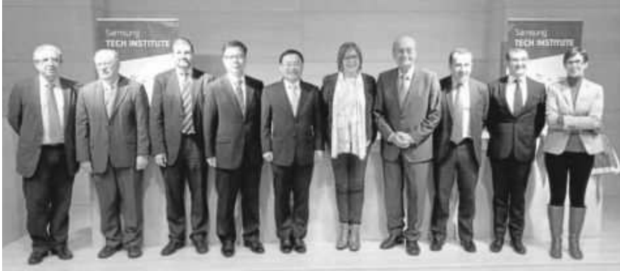
Representantes de la UMA y de Samsung, en la presentación del curso formativo.