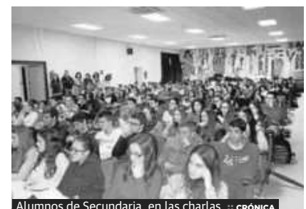
Alumnos de Secundaria, en las charlas. :: CRÓNICA

Algunas de las figuras públicas que asistieron al acto fueron la rectora de la Universidad de Málaga, Adelaida de la Calle, y el alcalde Francisco de la Torre. Las ponencias que tuvieron lugar trataron asuntos relacionados principalmente con la prevención de riesgos laborales.