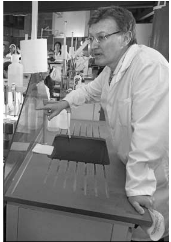
Un investigador imparte clases en un laboratorio de la Hispalense. D.S.

Las acciones estratégicas contarán con dotación de espacios e infraestructuras, mientras que